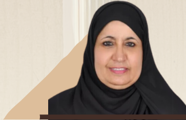
معالي الأستاذة/ نورة بنت عبدالله الفايز عضو