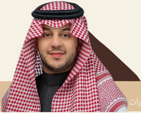
الأمير / سعود بن سلطان آل سعود نائب رئيس مجلس إدارة الجمعية السعودية للمحافظة على التراث