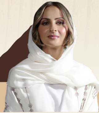
صاحبة السمو الملكي / الأميرة سارة بنت بندر آل سعود رئيس مجلس إدارة الجمعية السعودية للمحافظة على التراث