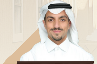
الأمير/ نواف بن عبدالعزيز بن عياف آل سعود عضو